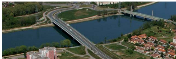
Le pont de la soie depuis le canal (élément du BUE)